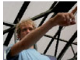
Van Wenen op naar Boedapest.

De volgende halte is Boedapest. Waar de broodjes voor belachelijk lage prijzen over de toonbank vliegen en zwartrijden in de trams de gewoonte zaak van de wereld is. ●