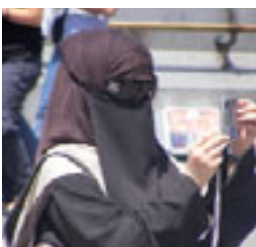
Chanel voor de ogen.