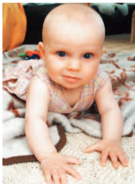
Knuddeliger Nachwuchs – die meisten deutschen Eltern sehen darin eine Bereicherung ihres Lebens.

Viele junge Paare fürchten, durch ein Kind mit jeder Menge neuer Beziehungsprobleme konfrontiert zu werden: Der Nachwuchs lässt einem nicht mehr viel Zeit für ungestörte Zweisamkeit, durchwachte Nächte zehren an den Nerven und finanzielle Einschränkungen führen zu Streitereien. Dass Kinder jedoch eine wahre Bereicherung für jede Beziehung sein können, zeigt eine aktuelle Umfrage des Apothekenmagazins „Baby und Familie“. Zwei von drei der befragten 560 Mütter und Väter gaben an, durch ihre Kinder sei ihre Partnerschaft erst richtig liebevoll und innig geworden. Nur eine Minderheit von 12,6 Prozent beklagte sich darüber, dass ihre Beziehung durch den Nachwuchs gelitten habe. Knapp acht Prozent gaben zu, nur noch der Kinder wegen die Partnerschaft aufrecht zu erhalten. dpa