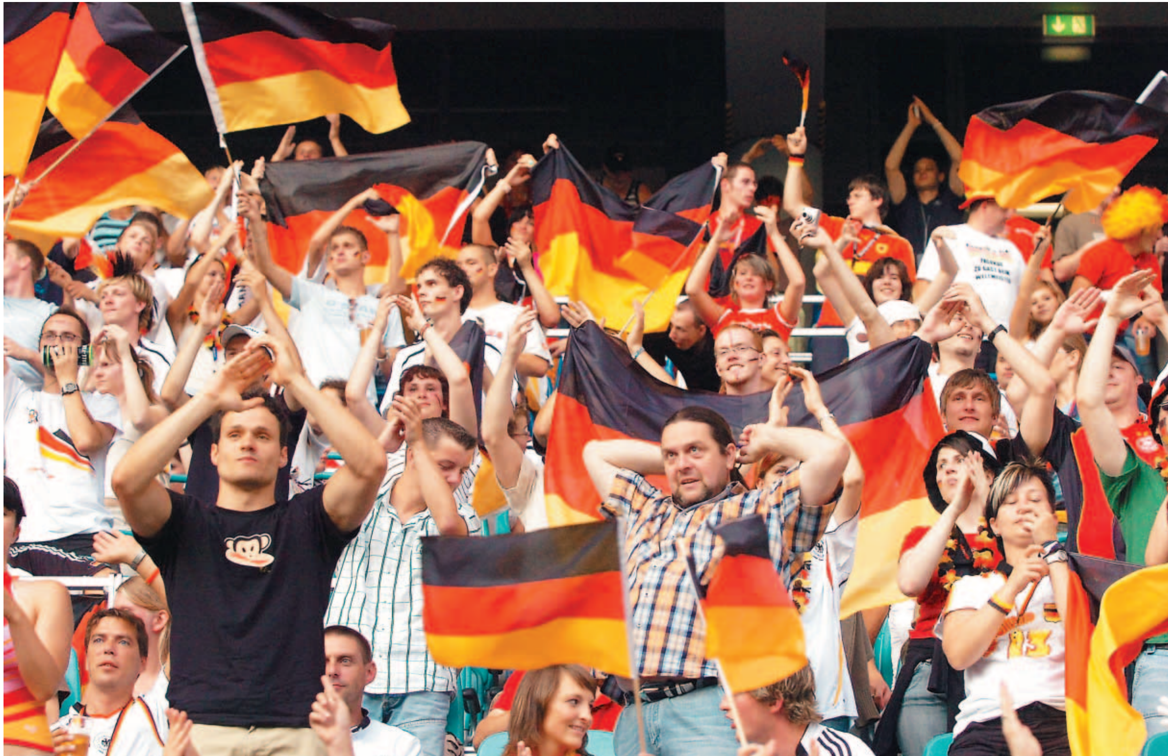
Jubelstimmung während der Fußball-Weltmeisterschaft 2006 im Leipziger Zentralstadion – für Zukunftsforscher Horx ein Zeichen dafür, dass die Deutschen ihre neurotischen Traumata loswerden.

Frage: Sind Sie mehr ein Advokat des Zukunftsoptimismus oder eher das Orakel von Kelkheim?