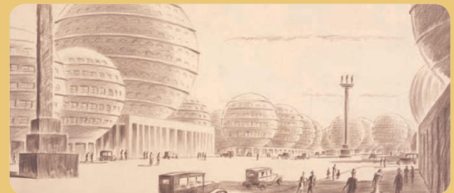
Bild rechts oben: Wenzel Hablik, Der Bau der Luftkolonie, 1908. www.wenzel-hablik.de Bild rechts unten: Wenzel Hablik, Siedlung Scharzwald, 1920. www.wenzel-hablik.de Bild links unten: Peter Birkenholz, Kugelhausstadt, 1927. www.architekturmuseum.de

Zu allen Zeiten haben sich die Menschen darüber Gedanken gemacht, wie die Städte und Häuser in der Zukunft aussehen werden. In visionären Entwürfen greifen Architekten die Probleme der Gegenwart auf. Sie suchen nach Lösungen für ungünstige Wohnverhältnisse und Umweltprobleme oder gehen an gegen räumliche Zersiedelung und den Stillstand in der Bauwirtschaft. Während manche Pläne auf ewig Utopien bleiben, wirken andere auf das Bauen und Wohnen von morgen.