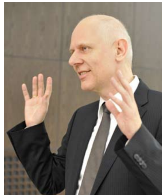
LINKS UND OBEN Einige Zukunftsszenarien scheinen den Männern greifbar nah.

BEUTELMANN Ich gebe zu, dass in unserer Branche die oberen Führungsetagen noch relativ dünn mit Frauen besetzt sind. Auf der Ebene der Teamleitung oder Gruppenleitung sehe ich keine Probleme. Warum das nicht weiterreicht in die Bereiche Abteilungsleitung, Hauptabteilungsleitung oder Vorstand, dafür kann ich Ihnen – offen gesagt – keine hinreichende Erklärung geben.